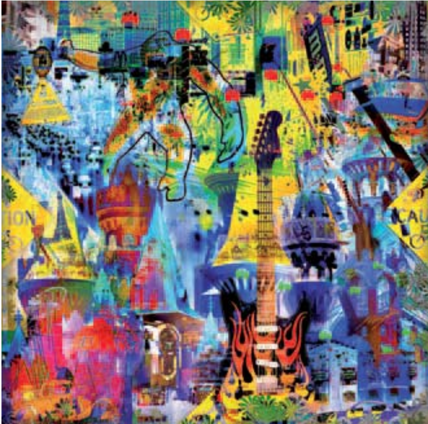
USA, collection Transparencies

d'échanges où la création artistique sera à l'honneur et où l'interaction, la parole sera proposée au public. Un ensemble d'acteurs passionnés et de haute qualité qui feront de ce festival un pôle d'attraction et un repère dans le temps au sein de cette Genève bien internationale.